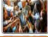
Un journaliste صحفي